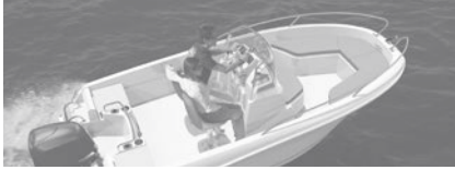
Cap Camarat 4.7 CC